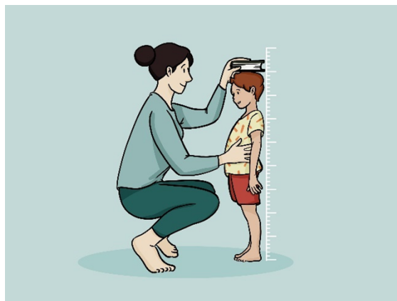
Obr. 1: Pravidelné meranie výšky dieťaťa